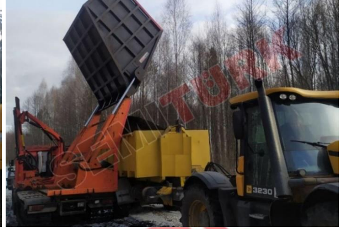
Paletli araç şasisi üzeri uygulama - “Yana Devrilir Yüksek Damperli Taşıma Kovaları”