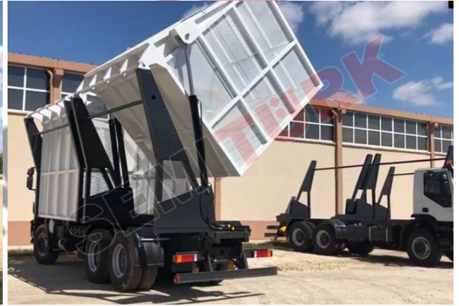
Kamyon şasisi üzeri uygulama - “Silaj Hasadı İçin Yüksek Yana Devrilir Araç Üstü Damper”