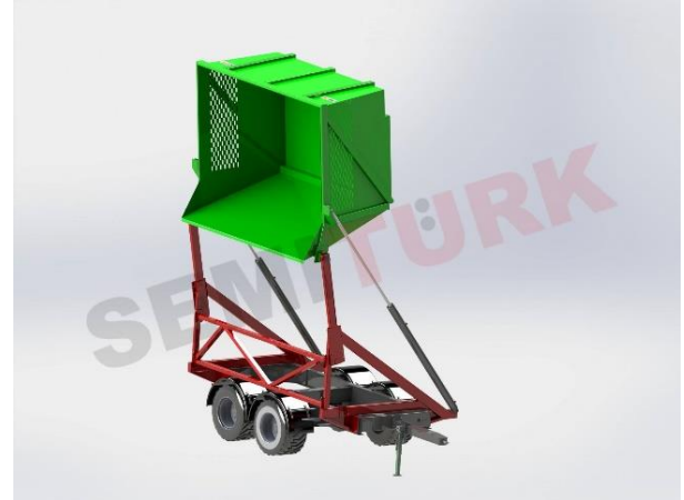
Römork şasisi üzeri uygulama - “Şeker Kamışı Damperli Yana Devrilir Römork”